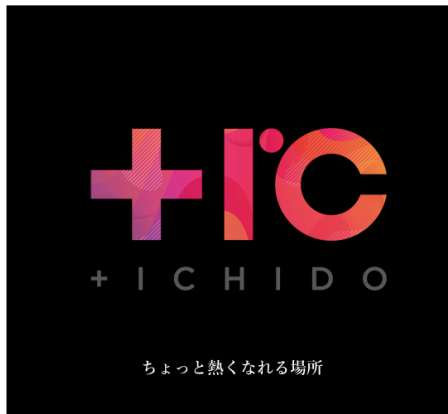
ちょっと熱くなれる場所

そしてその実現には、社員のみならず関わる全てのステークホルダーが前向きなマインドをもって業務に取り組み、生産性の向上が実現するオフィス、そしてさらには社員が誇りをもって働くことができる空間の構築が必要であると考え今回の移転となりました。