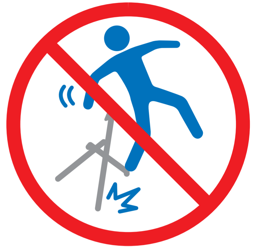
椅子の上に立たない