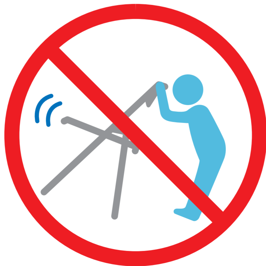
子供が折りたたみを行う際は 安全指導をする