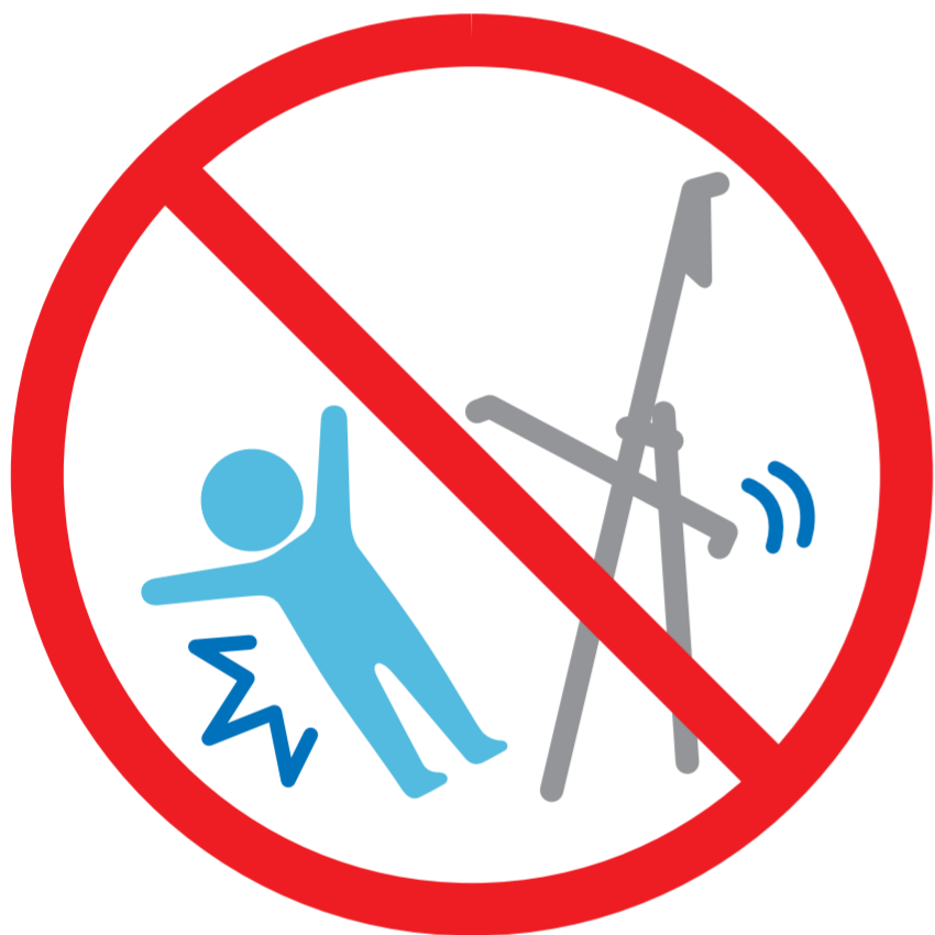
幼児がそばにいる時は 折りたたまない