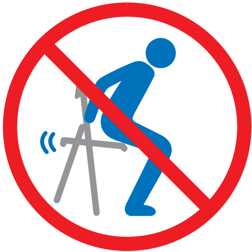
開いた状態で座る