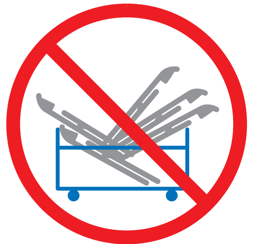
専用の台車を利用し 正しく収納する