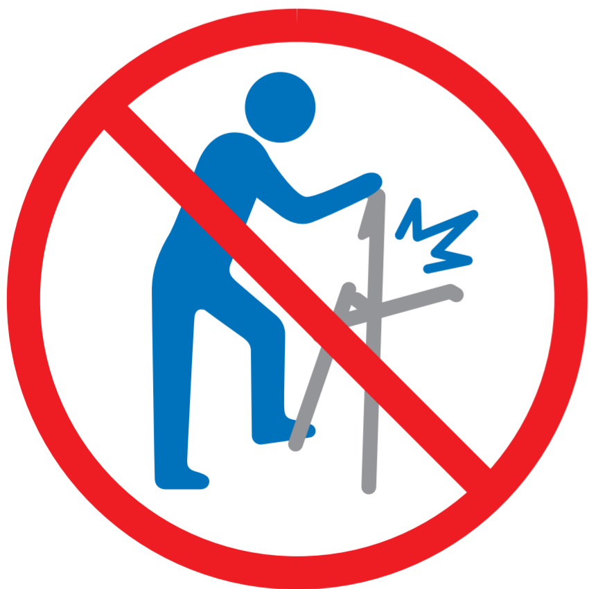
背と座を持ち ていねいに折りたたむ