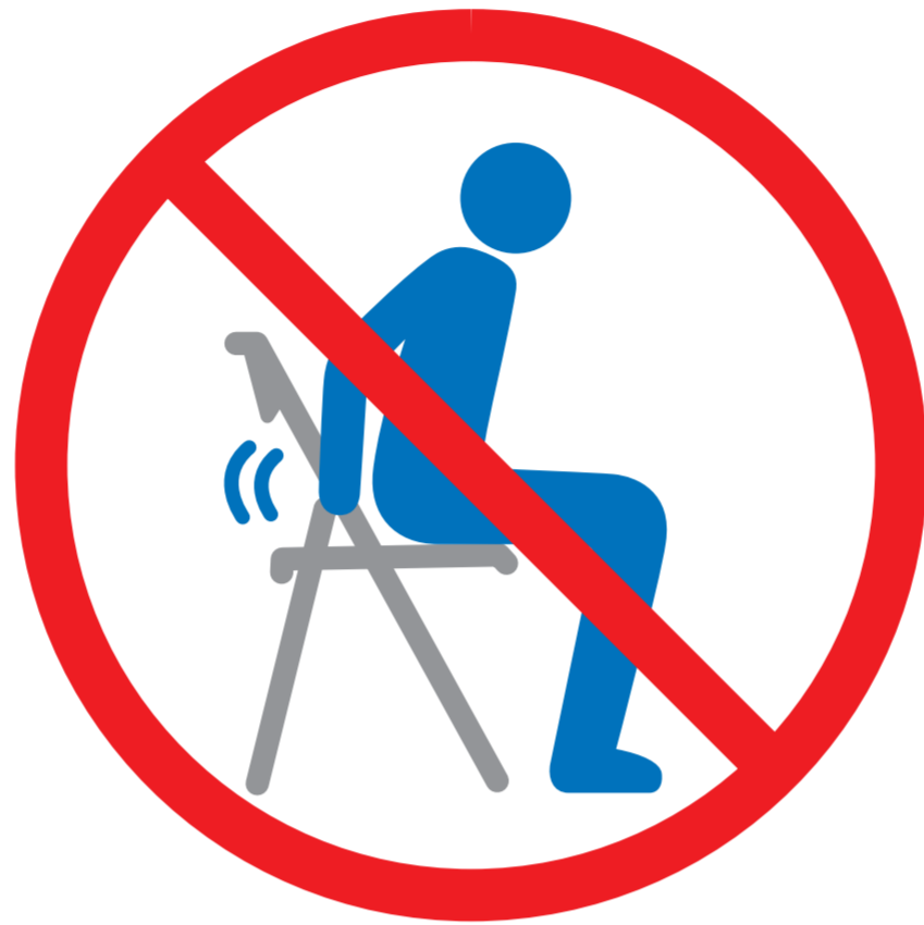
機構部に触れない